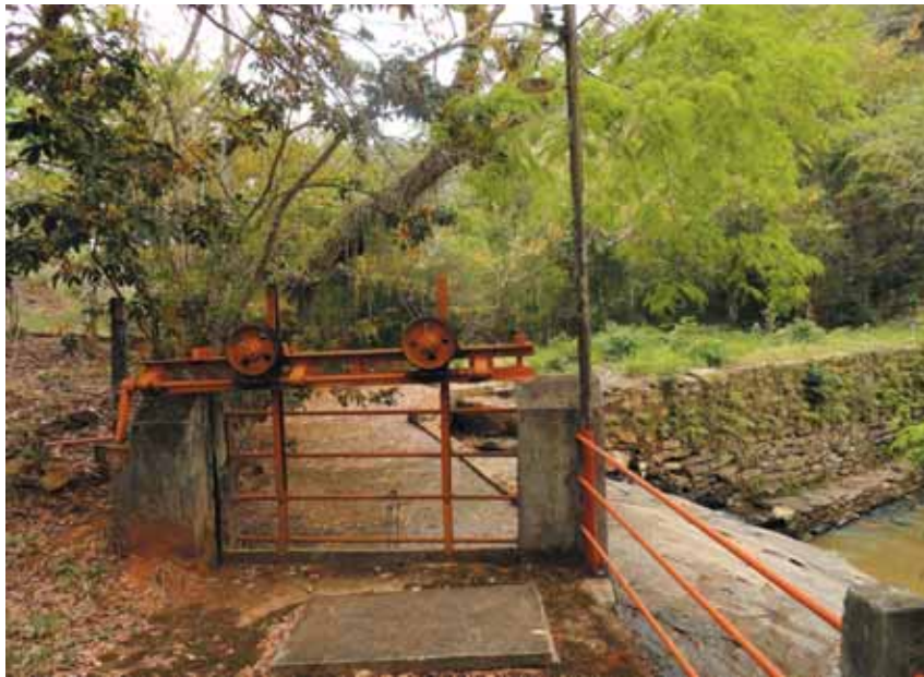
Esta comporta controla o fluxo d'água, que aciona a velha turbina, fornecendo luz abundante à propriedade e permitindo trabalhos de irrigação.

Informou-nos que, naquela época, não havia nenhuma árvore, era apenas um descampado, e hoje ele tem plantadas 71 palmeiras imperiais e 370 fruteiras.