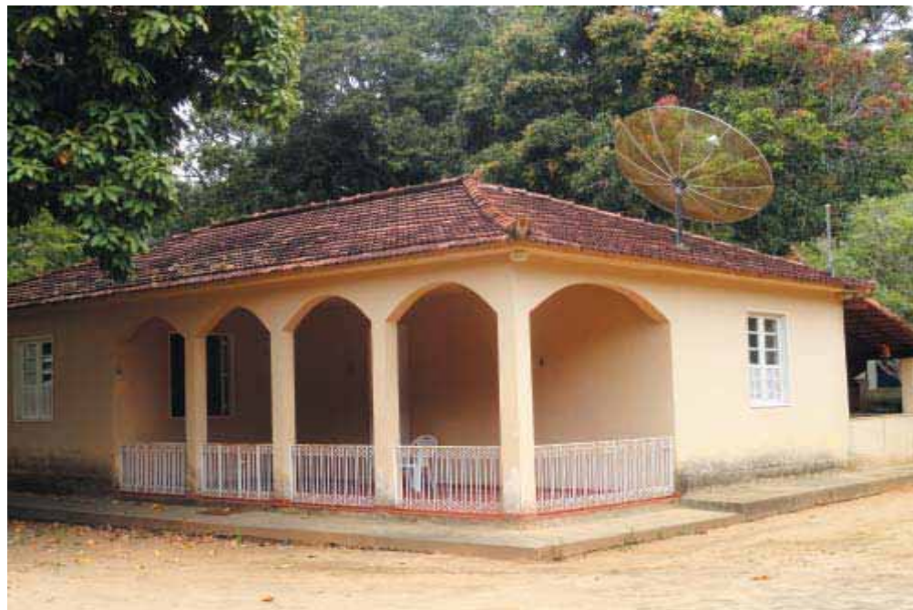
Sede da Fazenda Guarapiranga - Foto CEPEC, 2013

N atureza e trabalho humano em harmonia dão-nos visões agradáveis e animadoras quando surpreendemos realidades como a que oferece esta bela fazenda de Boa Sorte, distrito de Cantagalo, RJ.