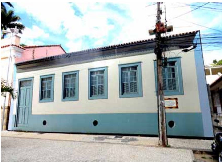
Rua Nilo Peçanha (Antiga Rosário) número 90. Aqui abrigou-se o jornal numa de suas mais progressistas fases. Década de 50, na qual Cantagalo estava vivendo uma importante época de progresso político e social e embate de forças políticas...