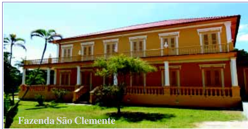
Fazenda São Clemente