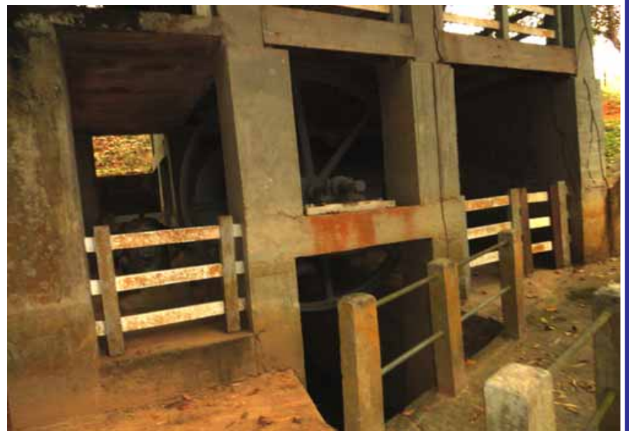
Para manter uma produtividade que colocou a Fazenda Guarapiranga entre as dez mais produtivas de Cantagalo, seu proprietário cuidou muito bem das instalações que abrigam o gado. .