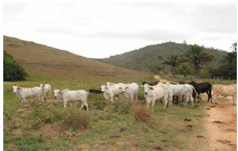
Gado de qualidade, muito bem tratado em Guarapiranga, garante a produtividade da fazenda.