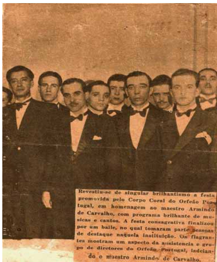
Revestiu-se de singular brilhantismo a festa promovida pelo Corpo Coral do Orfeão Portugal, em homenagem ao maestro Armindo de Carvalho, com programa brilhante de músicas e cantos. A festa consagradora finalizou por um baile, no qual tomaram parte pessoas de destaque naquela instituição. Os flagran-tes mostram um aspecto da assistência e grupo de diretores do Orfeão Portugal, deixando o maestro Armindo de Carvalho.

ARMINDO DE CARVALHO brilhou como Maestro no Rio de Janeiro, dirigindo o Orfeão Portugal.